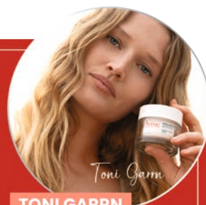
TONI GARRN FÜR AVÈNE.

2 Beim Kauf von Eau Thermale Avène Anti-Aging Produkten der Linien Vitamin Activ Cg, Hyaluron Activ B3 und/oder Dermabsolu im Gesamtwert von mindestens 20€ gegen Abgabe des Rabattcoupons in teilnehmenden Apotheken einlösbar. Aktionszeitraum: 15.01.-15.03.2025.